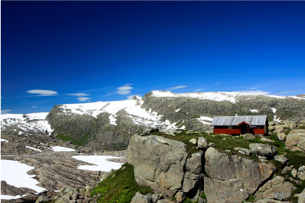
Blåbrebu, ei av Flora turlag sine to hytter i Ålfotbreen landskapsvernområde.