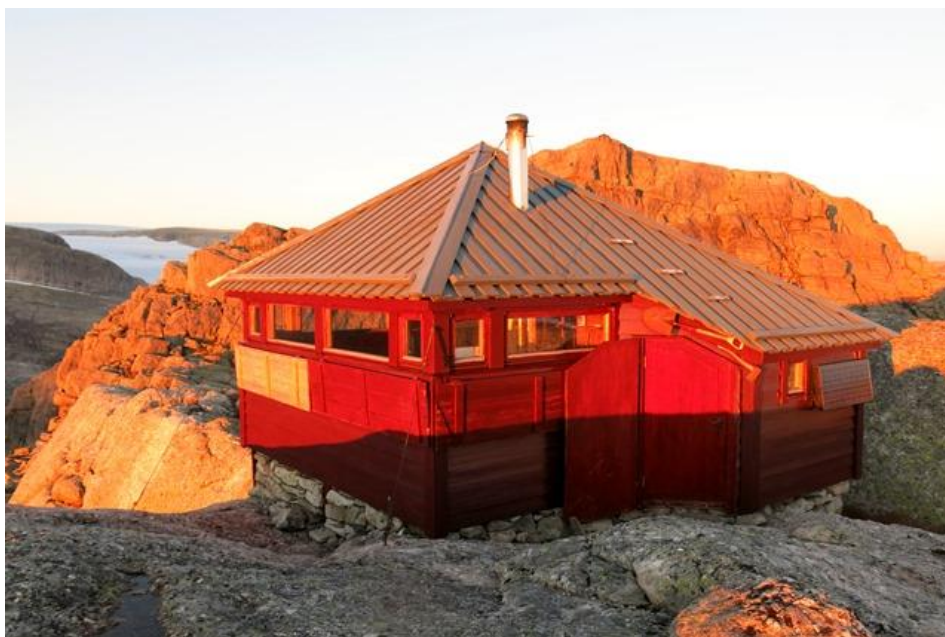
Gjegnabu i solnedgong