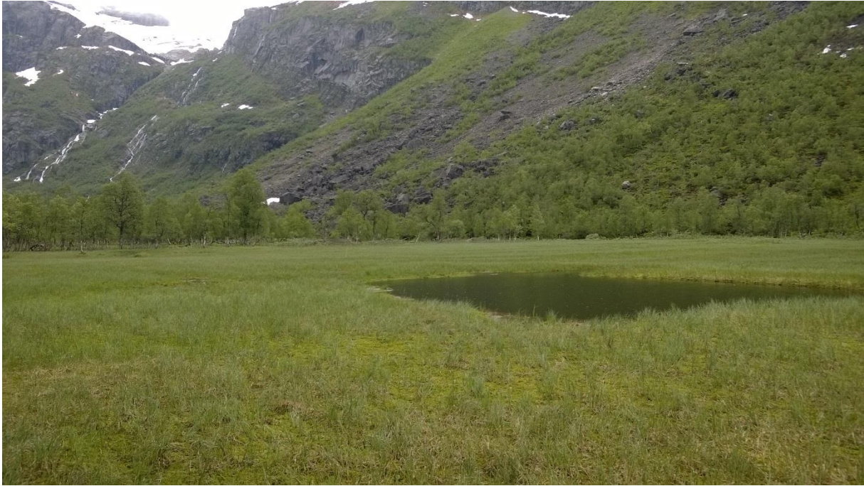
Elveslette i Straumsbotnen.