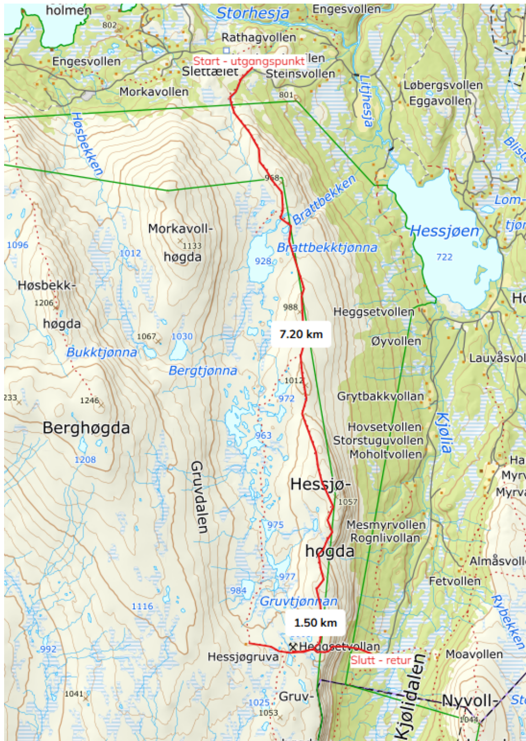
Figur 1: Kart for befaring den 24.06.2026. Slettælet (Start) - Hessgruva – Heggsetvollen (slutt).