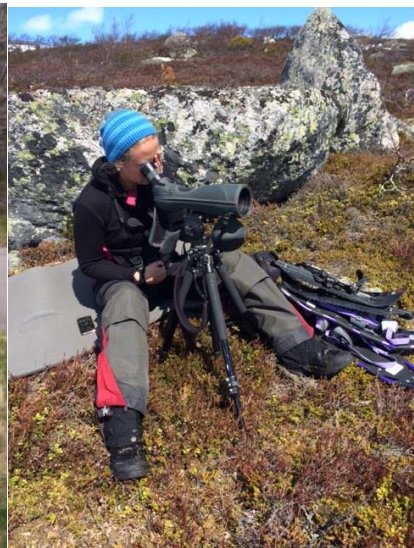
Forvaltninga var med i felt