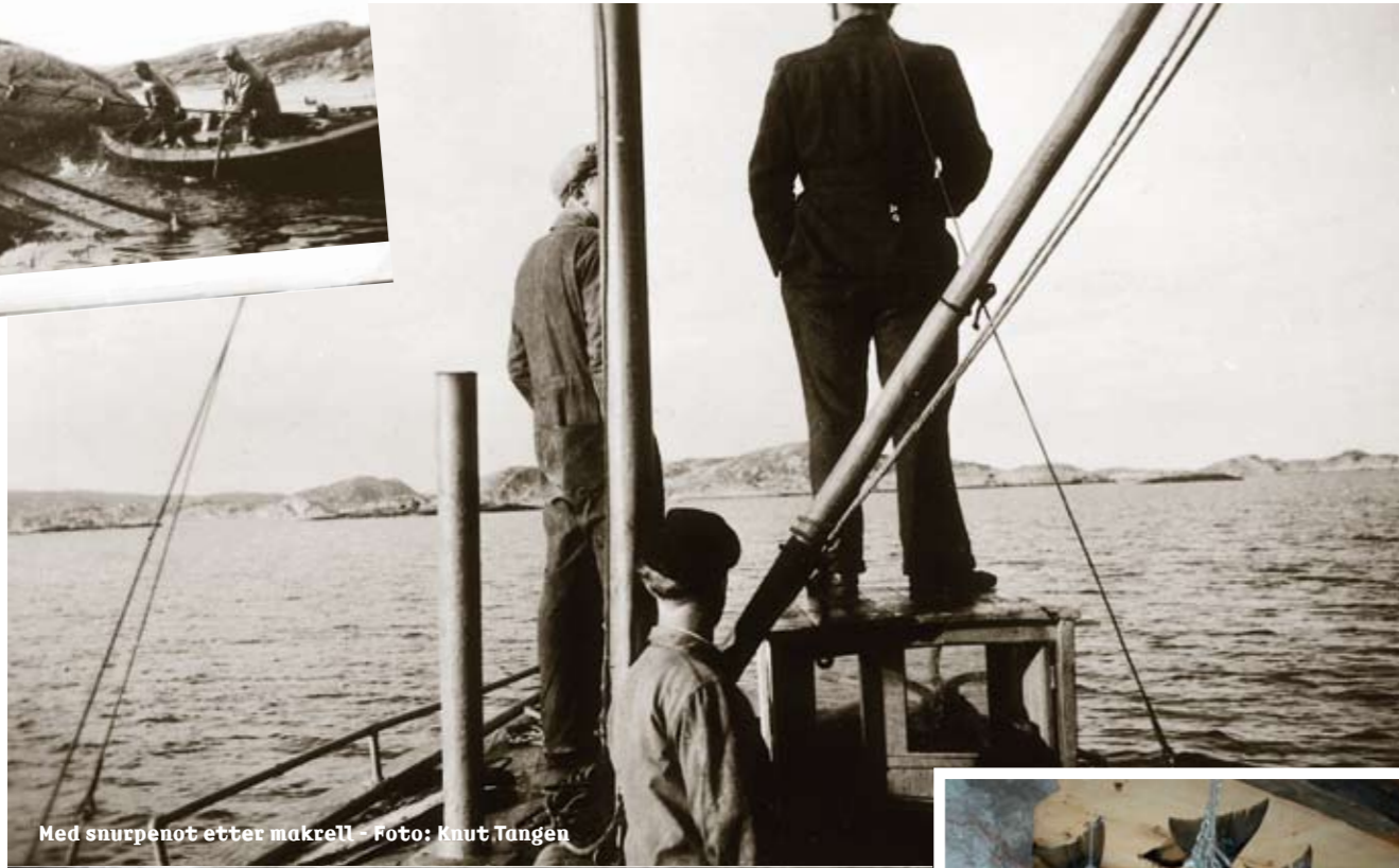
Med snurpenot etter makrell