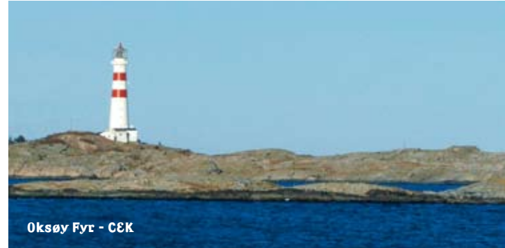
Oksøy Fyr - CEK