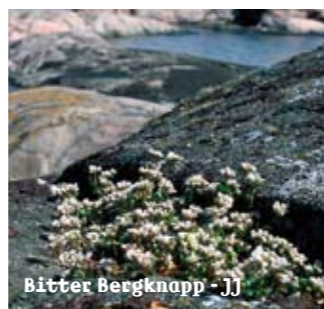
Bitter Bergknapp - JJ