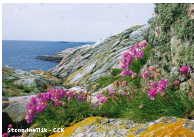
Strandneilik - C&K