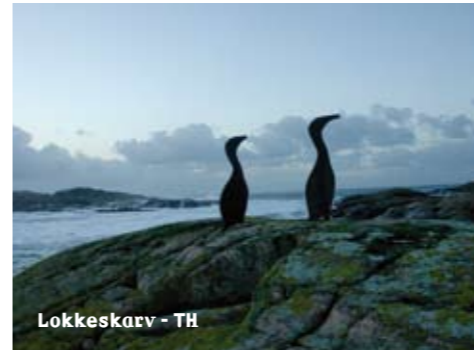
Lokkeskarv - TH

Kystfisket har vært en bærebjelke i livsgrunnlaget gjennom generasjoner. Vernereglene fører ikke til endringer for det tradisjonelle fisket. Kystfisket foregår i dag med relativt små båter. Det fiskes med garn, line og ruser etter torsk, sei, lyr, lange, kolje, lysing, ål og flatfisk. Reker fiskes hele året. I sesongen drives makrelldorging, notfiske etter makrell og sild, laksefiske med kilenot, og teinefiske etter krabber og hummer.