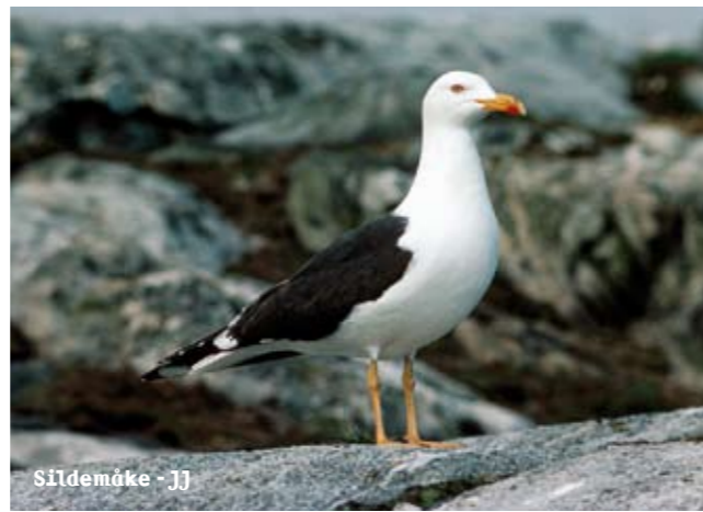
Sildemåke - JJ

PLANTELIVET. Floraen er spennende! Her møtes sørlige og nordlige plantearter, og arter med østlig og vestlig utbredelse. Fjellplanter fins også her ytterst ute i skjærgården. Skipstrafikk har bragt ballastplanter til området.