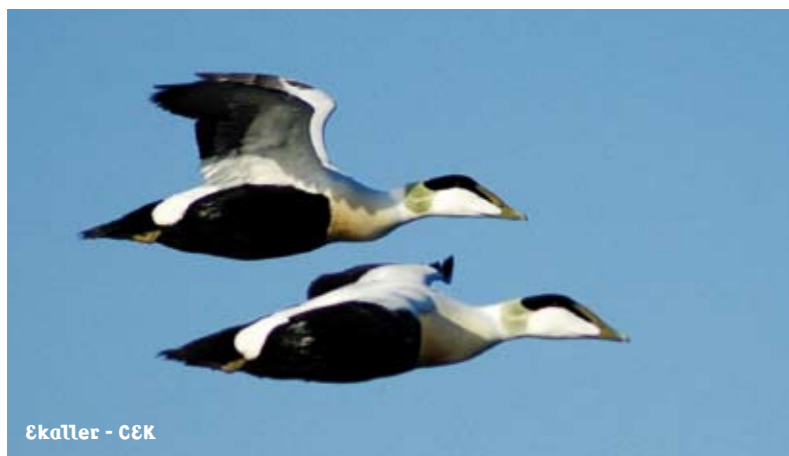
Ekafler - C&K