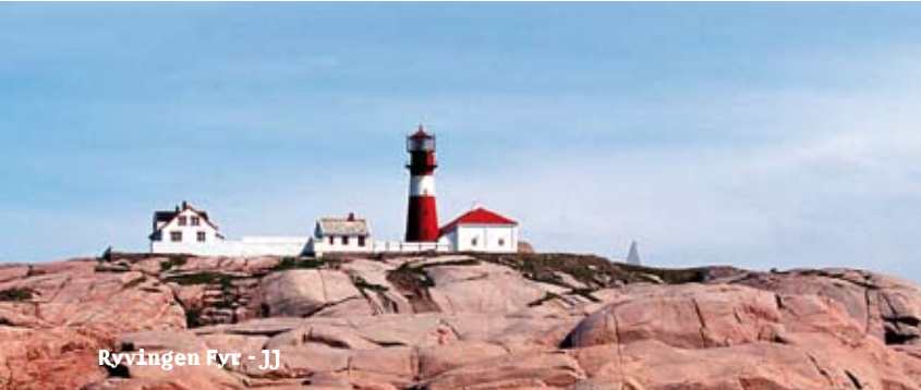
Ryvingen Fyr - JJ