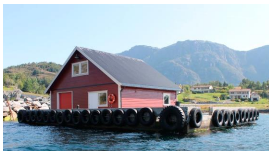
Bilde flytekai, frå salgoppgåve, Bremanger kommune

På eigedomen står det i dag eit nytt hovudhus og ein ny driftsbygning bygd som utleigehus med serveringslokale (bygd i 2004). I tillegg er det fleire utlær og stølshus på garden. I Finnabotnen er det ei kai i dårleg forfatning, og ei flytebyggje som ikkje er i bruk. Findebotten AS planlegg å kjøpa ei flytebyggja med hus som dei vil ankra opp i Finnabotnen. Flytekaia er på ca. 12 x 18 meter. Bygget er på ca. 9 x 9 meter og med 1,5 etasje. Det er bad i 2. etasje med avløp ut i sjø. Flytekai/lekteren er bygd med betong og flyteelement av isopor. Det er innebygd dieseltank i lekteren, som i salsoppgåva vert opplyst ikkje er tett. Fortøying av lekteren er med kjetting og tau. Det er gode moglegheiter for fortøying av både mindre og større båtar til lekteren.