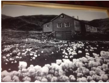
Foto frå søknad. Bygg frå 1953