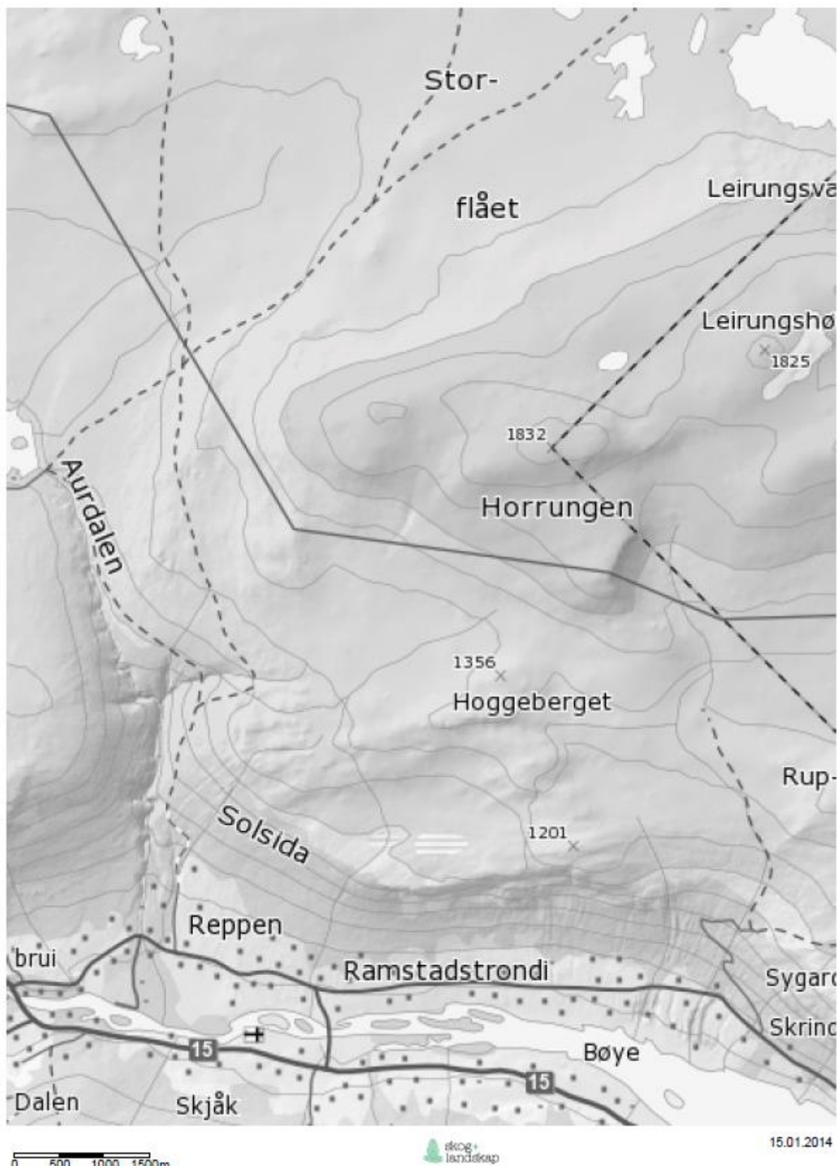
Figur 1. Kart over området.