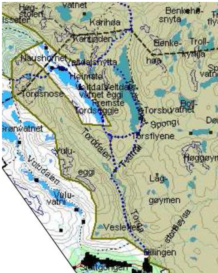
Figur 1. Utsnitt av temakart 3 merka turistløype vinter, Forvaltingsplan for Reinheimen.