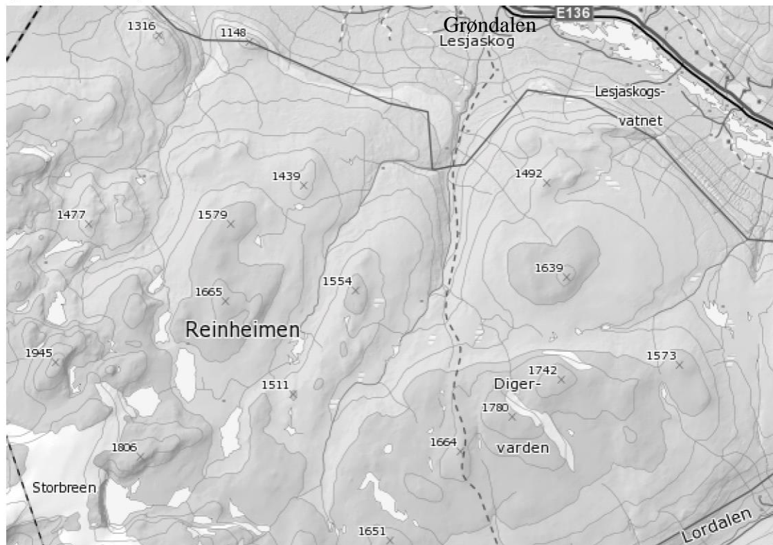
Figur 1. Kart over området.