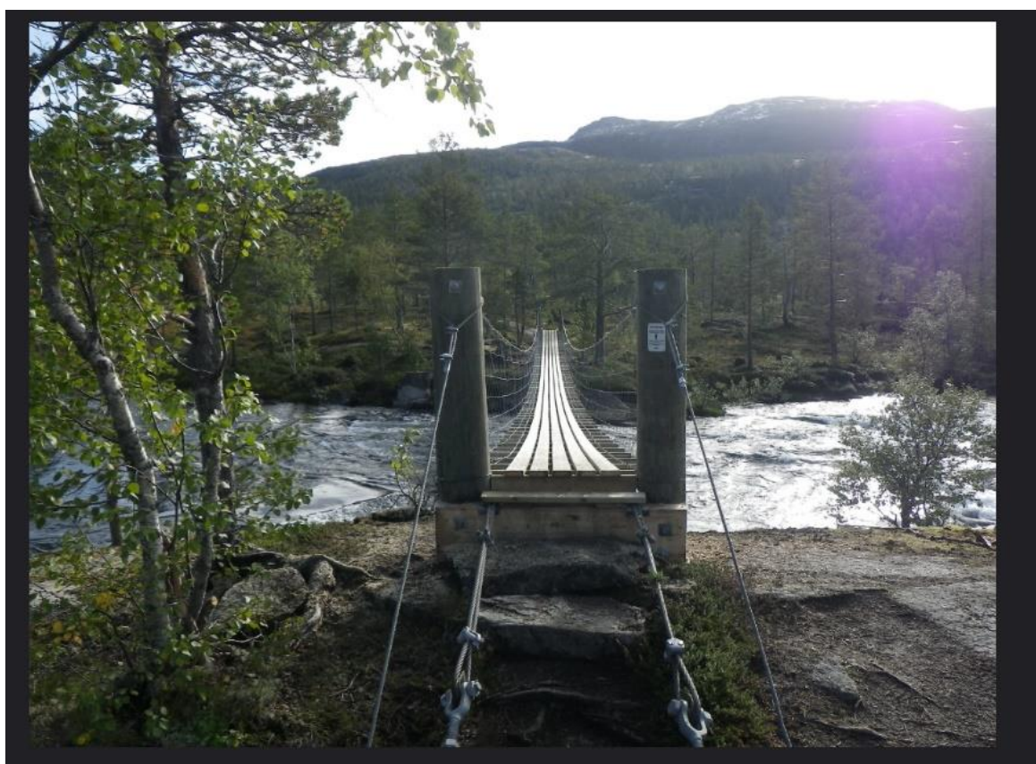
Bilde 1

Under. Eksempel på liknende bro som tenkt i Kvænangsbotn.