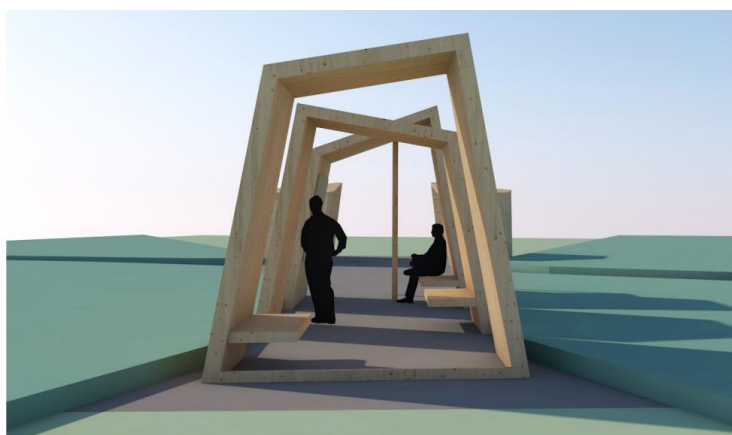
Utsikt mot sør

Det ble i 2019 engasjert arkitekt som fikk oppdrag med å planlegge dette på skissenivå. I 2020 tar vi sikte på videreutvikling av anlegget med en ny rasteplass/utsiktspunkt. Valg av løsning gjøres først på 2020 basert på skisser . Under skisse av en av løsningene.