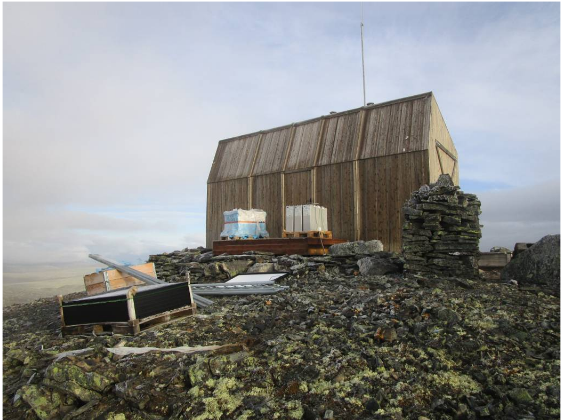
Bilde 1: Den nye basestasjonen på Veslhorungen under bygging.

Helikopteret vil fly mellom Myrin som brukes som lasteplass, og basestasjonen på Veslhorungen.