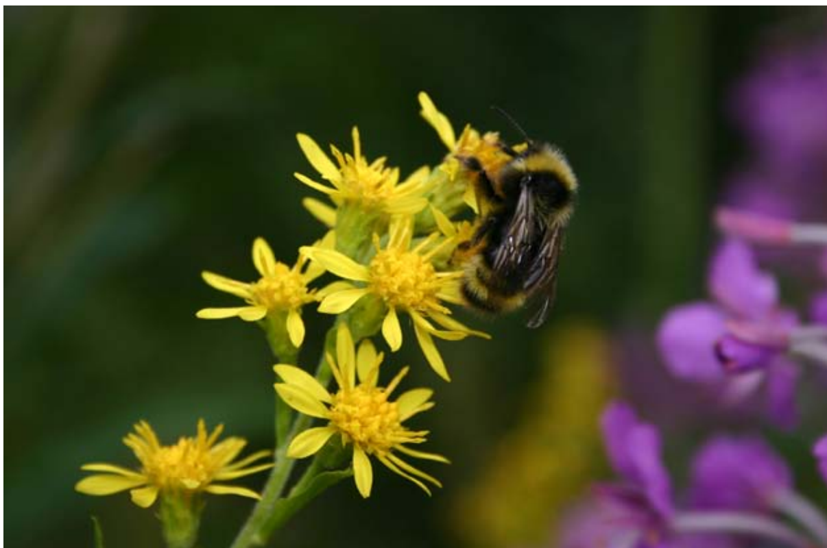
Naturen har en verdi i seg selv, en egenverdi, som gjør at all natur og alle arter har rett til å eksistere, f.eks. gullris og humle.

I urørt natur har vi mulighet til å studere og oppleve økologiske prosesser hvor mennesket selv ikke former hele miljøet. Kvalitetene i urørt natur har en sentral plass i naturvernet. Store deler norsk natur har gjennom generasjoner blitt påvirket av menneskets bruk. Dette preger både vegetasjon og