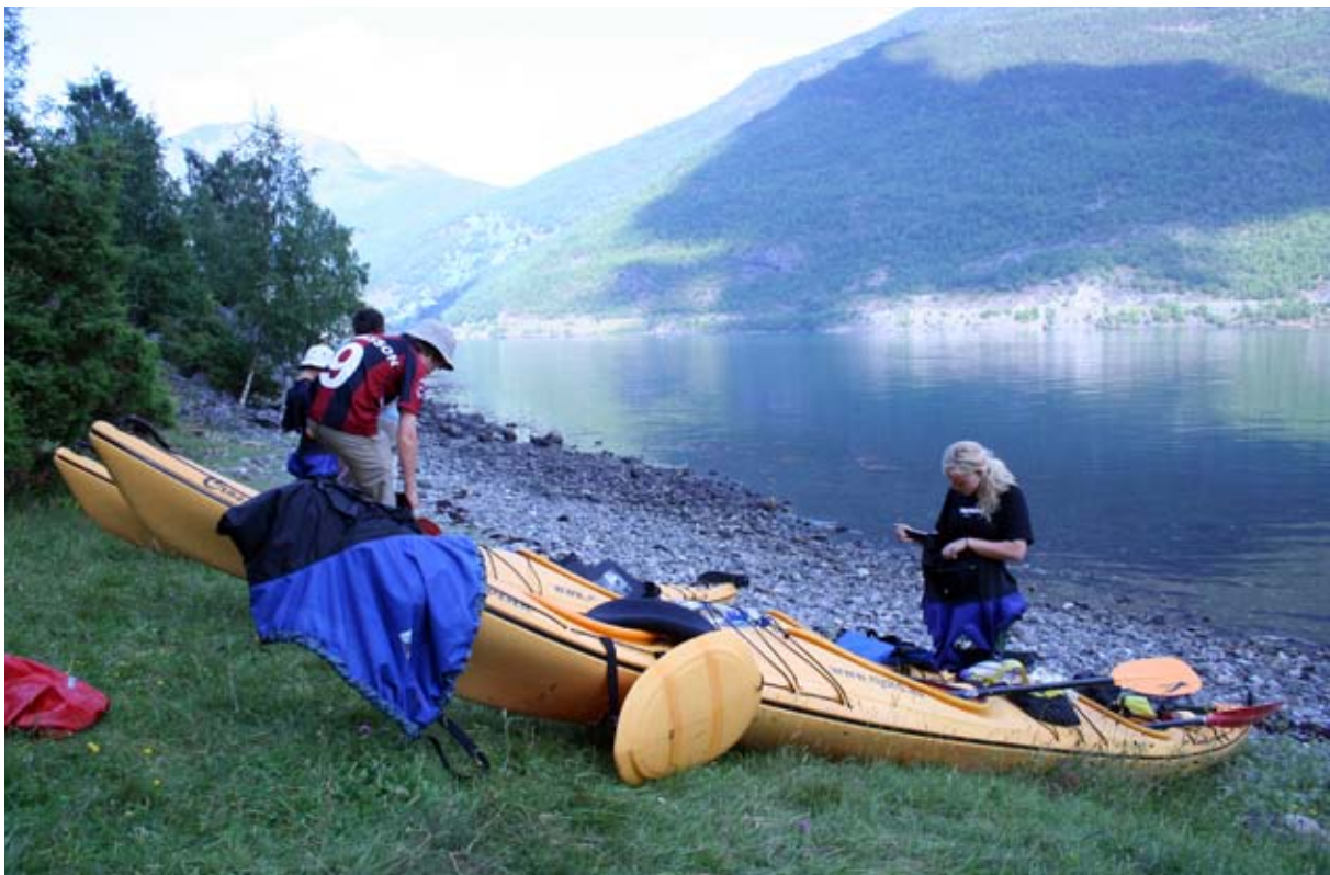
På tur i verdensarvområdet, Vestnorsk fjordlandskap i Nærøfjorden.

Stortinget behandlet våren 2003 spørsmålet om bærekraftig bruk av fjellområdene og bruk, vern og verdiskapning (St.prp.nr 65 (2002-2003), også kalt "Fjellteksten"). Gjennom Fjellteksten fremgår det at "Regjeringen mener likevel det er potensial for mer turistmessig bruk av våre verneområder, og vil åpne for økt miljøtilpasset turistvirksomhet som ikke kommer i konflikt med verneformålet i nasjonalparkene." Dette er senere fulgt opp gjennom Soria Moria-erklæringen i 2005. I denne sammenheng er det viktig å synliggjøre mulighetene som finnes for å utnytte verneområdene i forbindelse med naturbasert reiseliv, så lenge det ikke er i strid med det vi ønsker å ta vare på i disse områdene. Dette kan bl.a. gjøres gjennom klare retningslinjer for bruk av områdene gjennom forvaltningsplanene, jf. kap. 5.3.